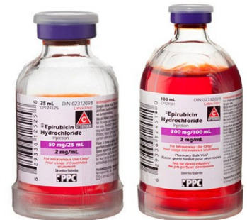
Illustration du 5 mL à venir bientôt